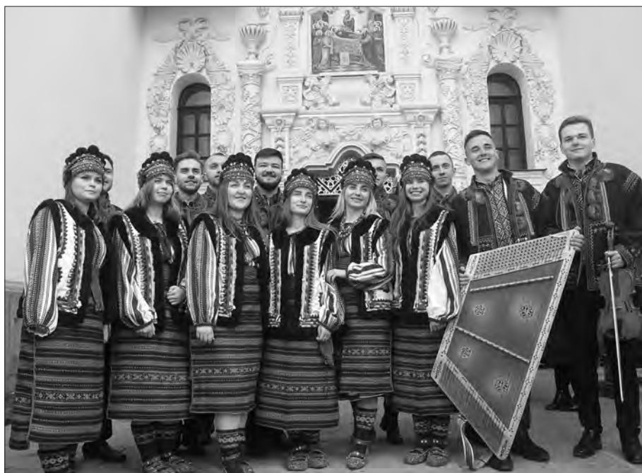
Перед Успенським собором звучать українські пісні.

Засновник — Верховна Рада України Свідчення про реєстрацію періодичного друкованого видання — КВ № 1 від 26.05.1994 р.