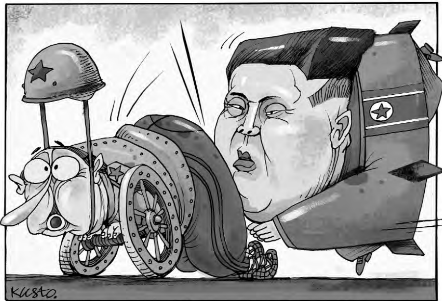
Притирання тиранів, або Бойове злагодження гармати і снаряда.